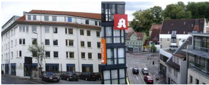
Außenfassade des Gebäudes (links), Blick aus der 2. Etage (rechts)

Planmäßig ist unser Studiengang Ende letzten Jahres in ein Bürogebäude an der Bergstraße 4, knapp 100 Meter vom BA-Hauptgebäude entfernt, umgezogen. Anfang Januar fanden dort bereits die ersten Lehrveranstaltungen statt.